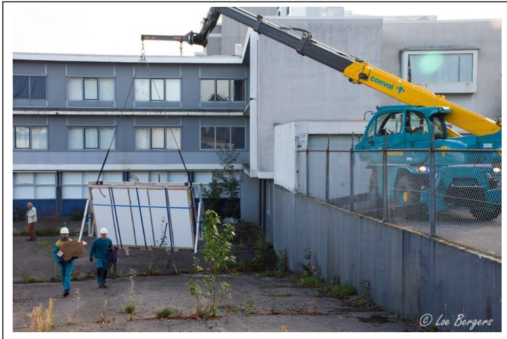
Vertrek bij Macintosh in Stein