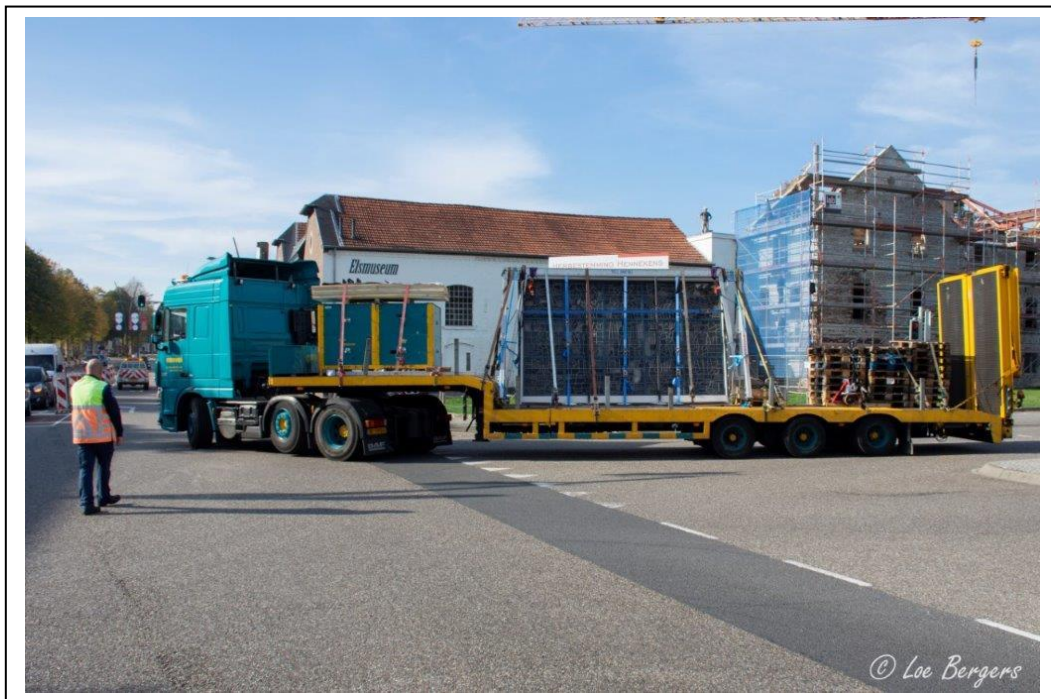
Transport naar Beek