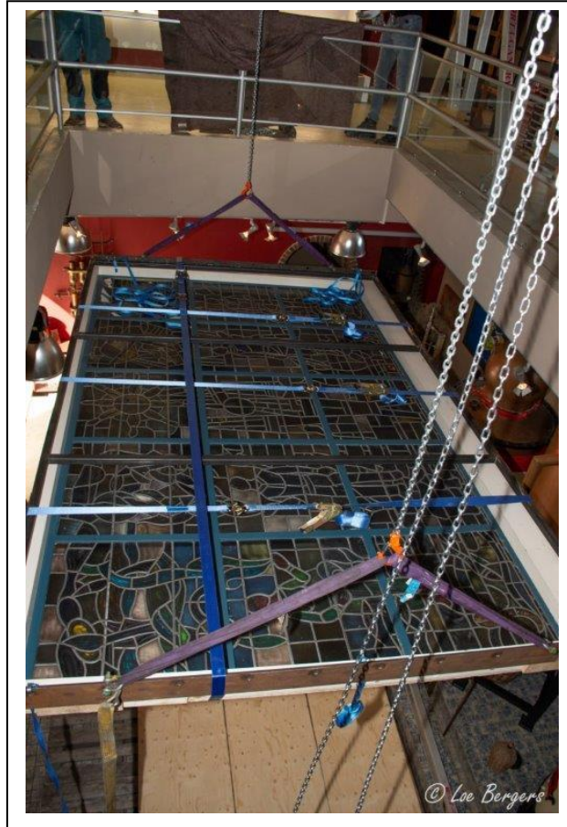
Hijzen naar bovenverdieping via vide