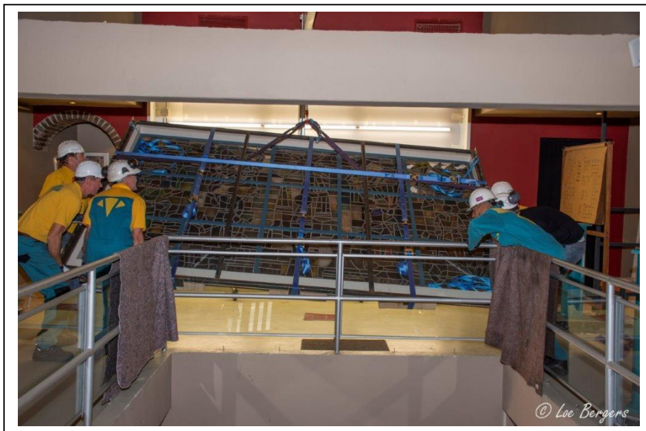
Kantelen naar definitieve positie